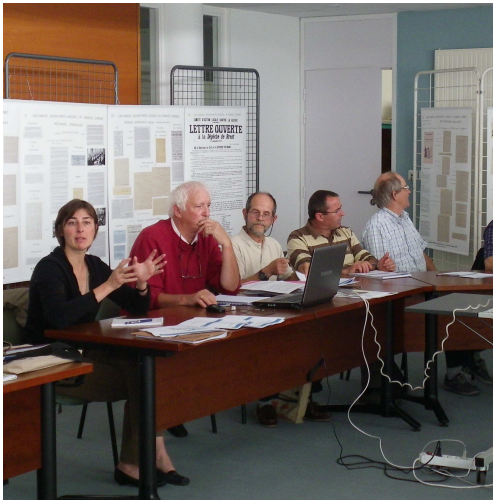
Groupe de travail « Organisation de la plaisance et du carénage, 15 juin 2011, Loperhet.