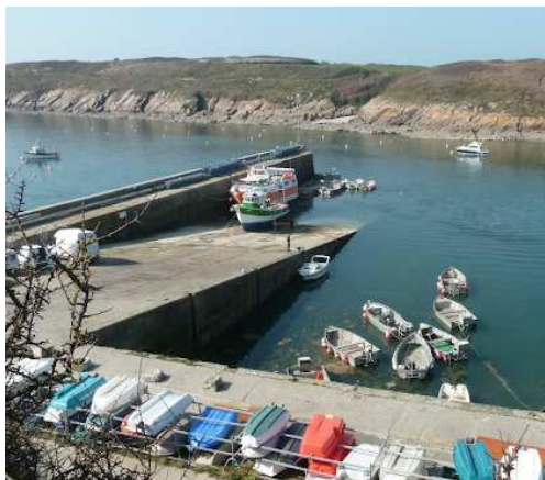
Cale et môle St-Christophe, Le Conquet.