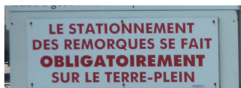
Eléments de gestion de cale.