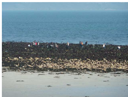
Pêcheurs à pied par grande marée, Camaret.

Cette reconnaissance du travail mené par les acteurs de la mer et du littoral est le fruit d'une démarche portée par les élus du Pays de Brest depuis 2010 et d'une prise de conscience d'un besoin de se rassembler autour de projets partagés en vue de préserver et de développer son potentiel maritime.