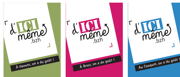
Logo utilisé par un producteur à Hanvec