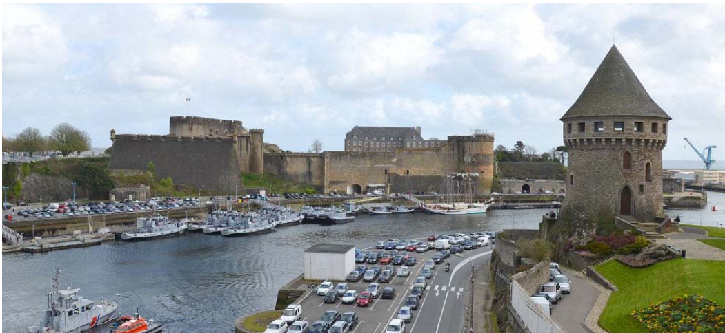
Brest